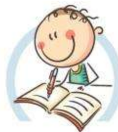
4. СИДИТЕ ПРАВИЛЬНО