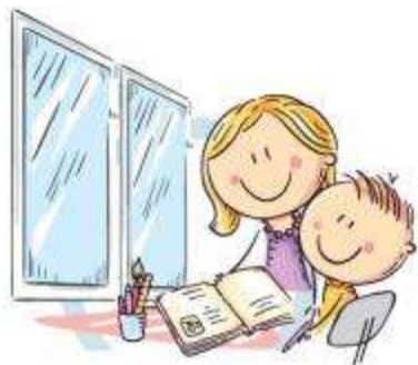
1. ЕСТЕСТВЕННОЕ ОСВЕЩЕНИЕ

ЕДИНЫЙ КОНСУЛЬТАЦИОННЫЙ ЦЕНТР РОСПОТРЕБНАДЗОРА 8-800-555-49-43