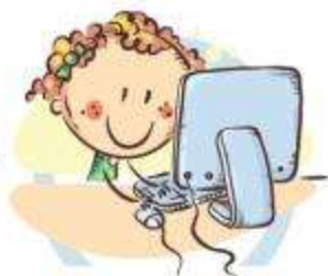
2. ПОЛОЖЕНИЕ МОНИТОРА