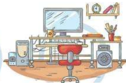
5. СООТВЕТСТВИЕ МЕБЕЛИ