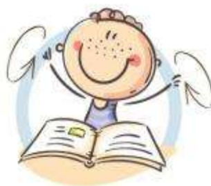
2. ФИЗКУЛЬТМИНУТКА для снятия утомления с ПЛЕЧЕВОГО ПОЯСА И РУК