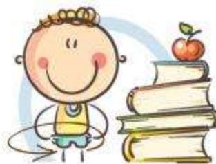
3. ФИЗКУЛЬТМИНУТКА для снятия утомления КОРПУСА ТЕЛА