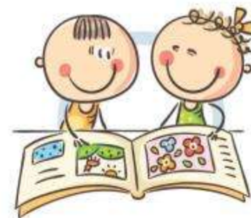
4. УПРАЖНЕНИЯ ГИМНАСТИКИ ГЛАЗ