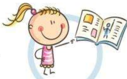
3. РАССТОЯНИЕ ДО КНИГ