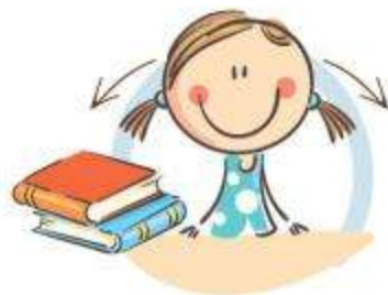
1. ФИЗКУЛЬТМИНУТКА для улучшения МОЗГОВОГО КРОВООБРАЩЕНИЯ